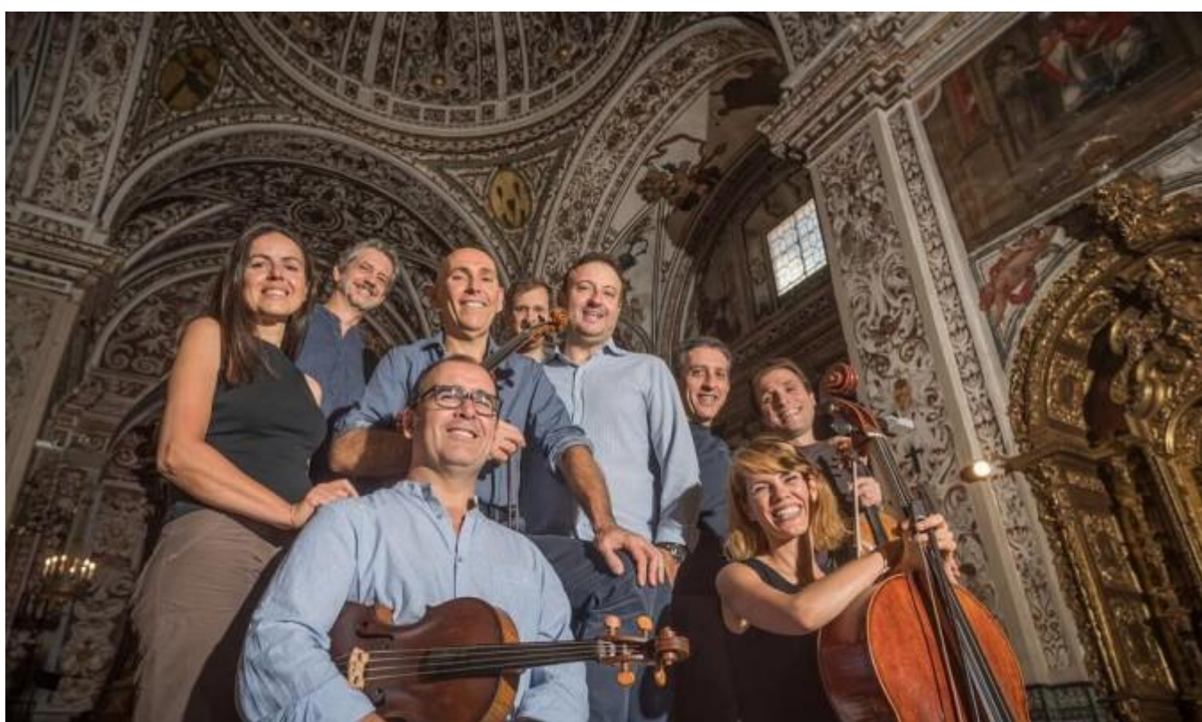
El elenco artístico del concierto.

JUAN JOSÉ ROLDÁN / SEVILLA / 12 OCT 2017 / 10:37 H - ACTUALIZADO: 12 OCT 2017 / 10:56 H.